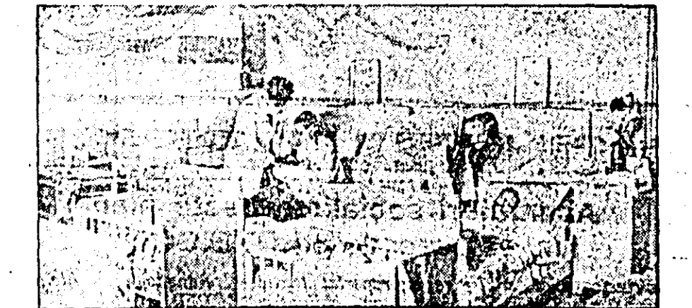
În clișeu: La casa de nașteri din Nădlac.

În multe comune și sate au luat ființă, în anul regimului democrat-popular, numeroase case de naștere.