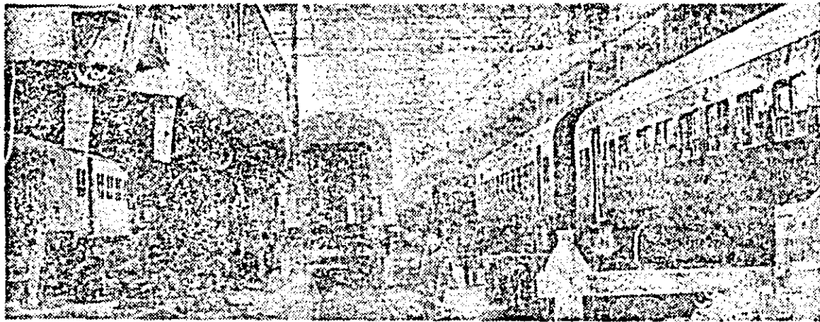
Întreprinderea de vagoane, sectorul II. În hala de montaj prind contur modernele vagoane pentru călători.