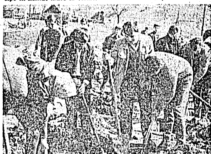
Aspect de la acțiunile de înfrumusețare a comunei Nădlao.

Săptămîna trecută s-a încheiat sub somnul deplinei desprimăvărări, îndemnînd tinerii din orașul și județul Arad să participe în număr mare la felurite manifestări utile și atractive.