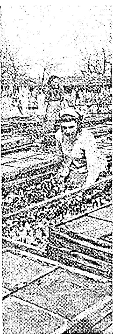
Răsadnițele cooperativei agricole de producție din Bujac se întind pe o suprafață de 2300 m.p. Răsadurile sînt bine dezvoltate — așa cum se vede din clișeu — datorită și îngrijirii deosebite de care se bucură din partea legumicultorilor.