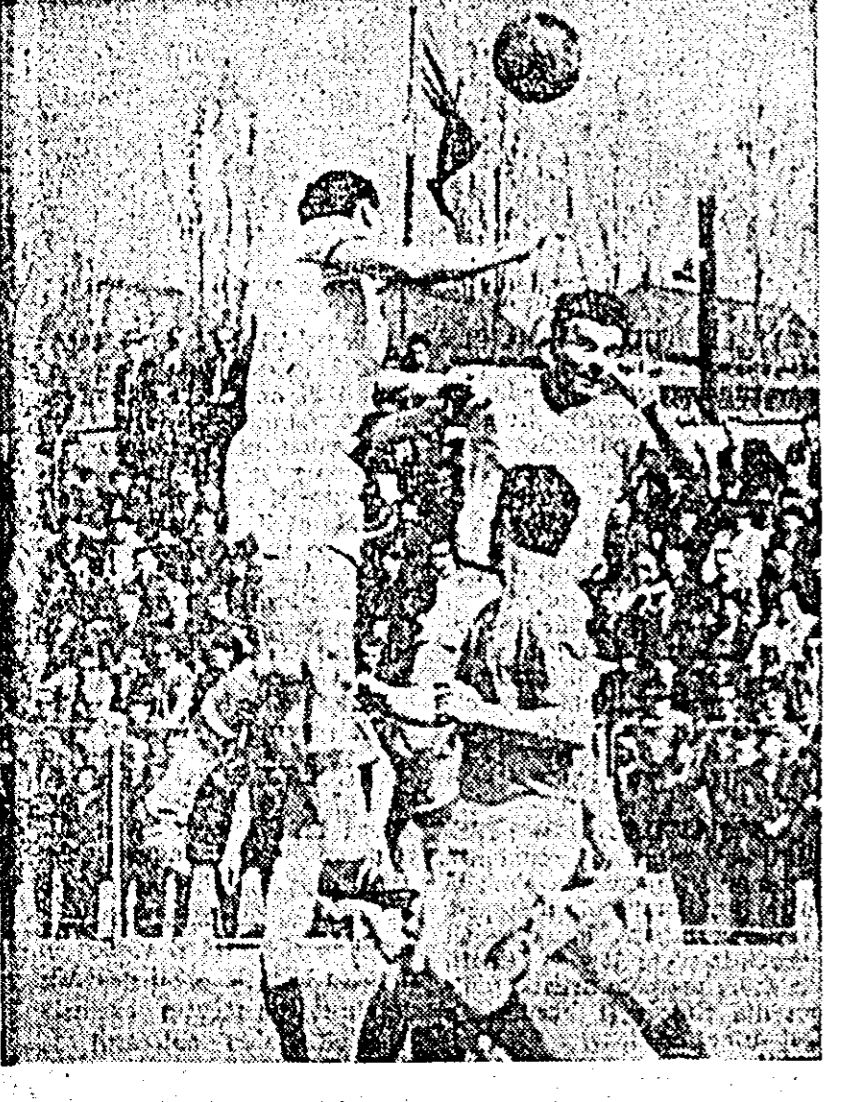
Fază din meciul Vagonul — CSM Reșița.