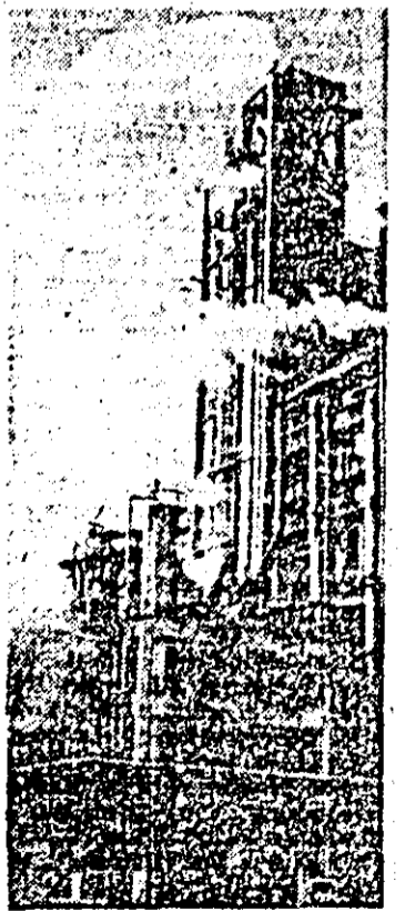
Combinatul de Îngrășăminte chimice Arad, vedere exterioară.