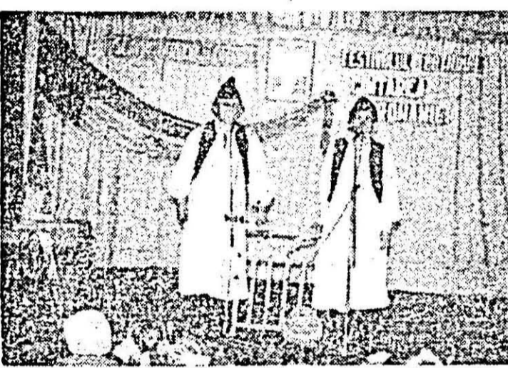
Secvență dintr-un recent spectacol al brigăzii artistice din satul Somosheș, comuna Cermel.