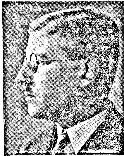
SCHUSCHNIGG KURT dr. Ausztria kancellárja

tanácskozást folytatott egymással, amely oly sokáig húzódott el, hogy a program is meg- rövidült. A tanácskozások és rövid sétaautó- zás után az osztrák kancellár fogadta a sajtó képviselőit, akik előtt előbb kegyeletesszavak-