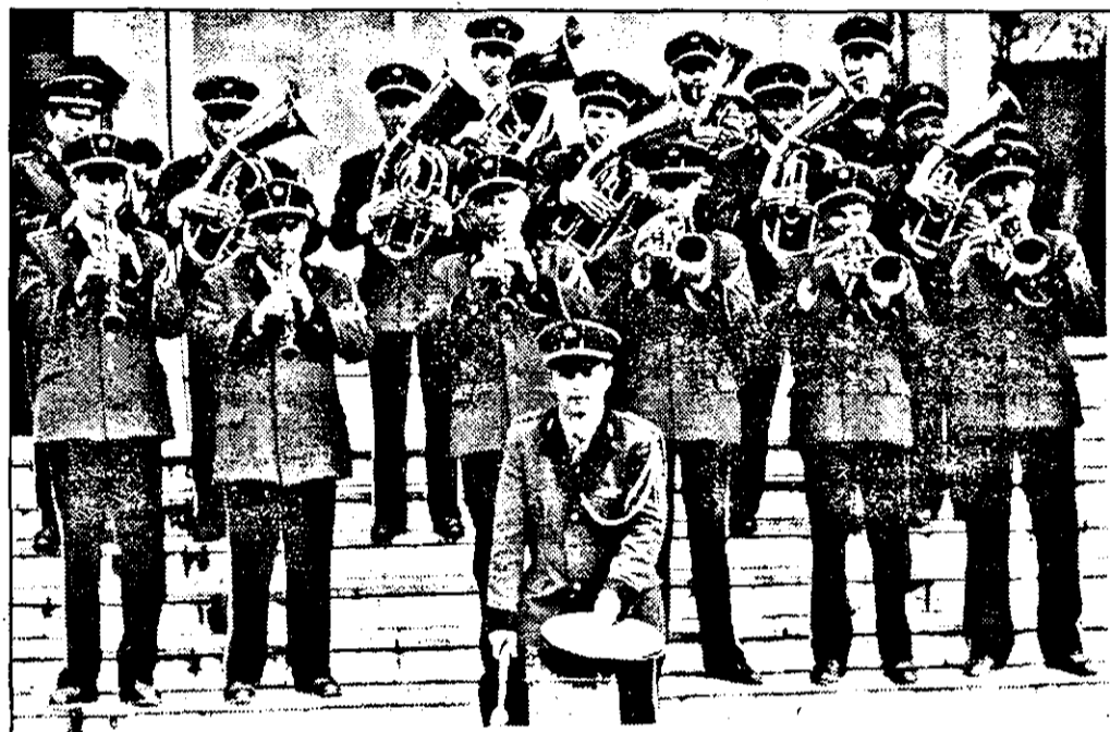
Fanfara din Nădlac

căpăta o mai mare amploare. Fără conotații nostalgice de o anumită factură, ci pur și simplu prin marcarea unei sărbători, de altfel tradițională la poporul român.