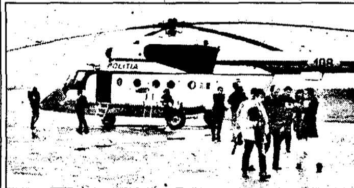
IGP a transportat aseară la București prețioasa captură folosind un elicopter.

DANA LASC SORIN GHILEA (Continuare în pagina a 4-a)