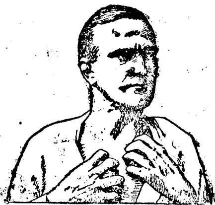
Ha bőrbetegséggel szenved, használja a CADUM-KENOCST

(Bucuresti, okt. 8.) Az egységes szakszervezetek irodájában tegnap ülést tartott a fémmunkások és a nyomdászok szakszervezete. Az ülés folyamán politikai kérdéseket is kezdtek tárgyalni s hevesen szidalmazták a hadbírósgot, mire a jelenlevő Pallade kapitány, katonai ügyész az értekezletet feloszlatta. A jelenlevők közül 3 munkást előállították, kiket kihallgatásuk után szabadlábra helyeztek.