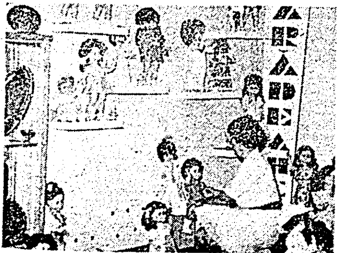
Și un colțisor din bogata expoziție a întreprinderii...

Lotă cum, fără s-o spună în mod explicit, Congresul al IX-lea al partidului a deschis drumul unei ramuri industria-