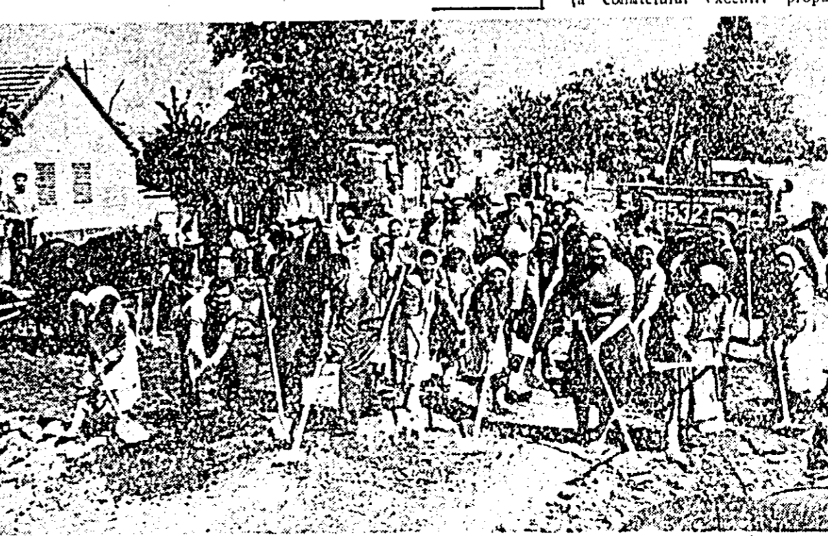
ÎN CLIȘEU: Un aspect din timpul muncii voluntare desfășurate pe str. Renașterii.

DUMITRU LAPĂDAT, DIMITRIE BOGDAN coresp.