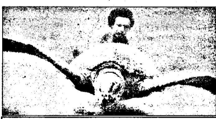
VOX - 19,15 LUMEA ANIMALELOR - DOC. SUA

6,40 Magazinul satului 7,00 Magazin matinal 9,00 Cuvântul Domnului 9,10 Cartoon Network - parada filmelor de desene animate 10,10 Emisiune pentru copii 12,05 Călătorie neașteptată - s. Canada 13/4: Prieteni în necaz 13,00 Știri, Meteo 13,10 Muzică populară maghiară - magazin 13,30 Familia SRL - s. distr. maghiar, rel. 14,00 Spitalul de urgență: s. SUA 22/3: Ce viață! 14,50 Vecinii - s. maghiar 15,20 Răspundem la telefoanele telespectatorilor 15,30 Acele minunate animale - doc. 15,55 Hyppolit și ceilalți 17,20 Modă '97 17,50 Mărci celebre 18,00 Căminul - mag. 18,40 Să vorbim corect 19,00 Panorama - mag. de politică 19,35 Roata norocului 20,00 Desene animate 20,15 Faptele maghiarilor