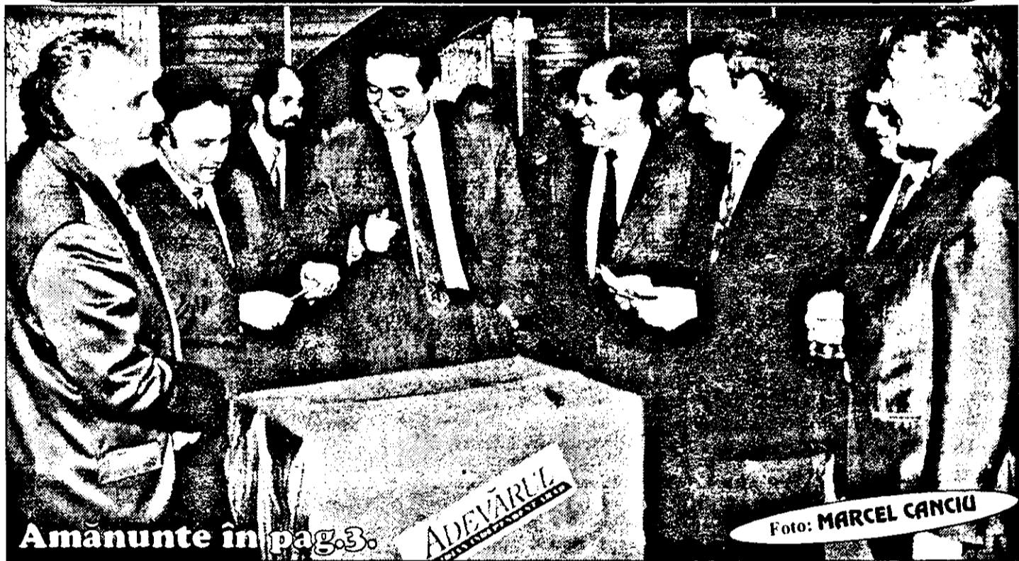
Amanunte în pag. 3.