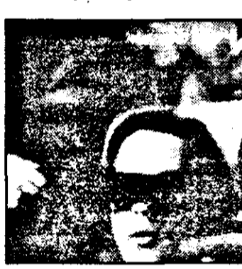
Pro 7: 21.15 Umilit - Adevărul și alte minciuni - dramă Germ. 19

7,05 Paradise Beach - s. am. 7,35 Exploziv - magazin 8,00 Sapte fix - mag. matinal 8,35 Între noi - s. germ. 9,05 Vremuri bune, vremuri rele - s. germ. 9,40 Springfield story - s. am. 10,35 Clanul din California - s. am. 11,30 Bogați și frumoși - s. am. 12,00 Concursuri tv 13,00 Magazin amiezii 13,30 Uite, cine ciocănește? - s. am. 14,00 Magnum - s. am. 15,00 Bärbel Schäfer talkshow: Femei prost dispuse 16,00 Iona Christen talkshow 17,00 Hans Meiser talkshow: Erotism și artă 18,00 Concurs tv. 18,30 Între noi - s. germ. 19,00 Magazin regional