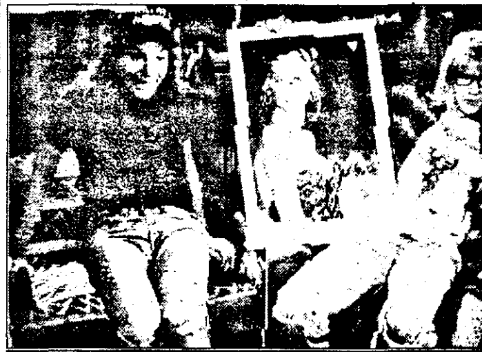
PRO 7 - 21,15 Lumca lui Wayne - comed. SUA 1992

8,30 Desene animate 8,55 Religie 9,05 Desene animate 10,00 Orașul negru - s. Ungaria 11,00 Trădătorul 11,00 Matineu - Rotonyi - portret muzical