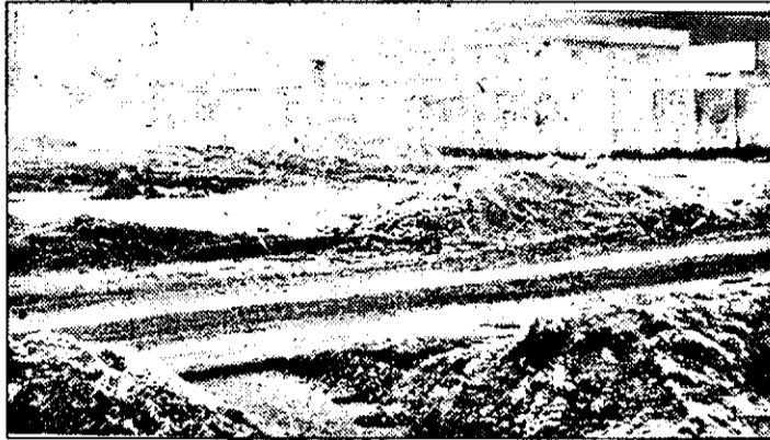
Aici a fost cândva o piață de animale. În locul ei stă o stație de benzină, un „patinoar” și munți de pământ. Deocamdată...