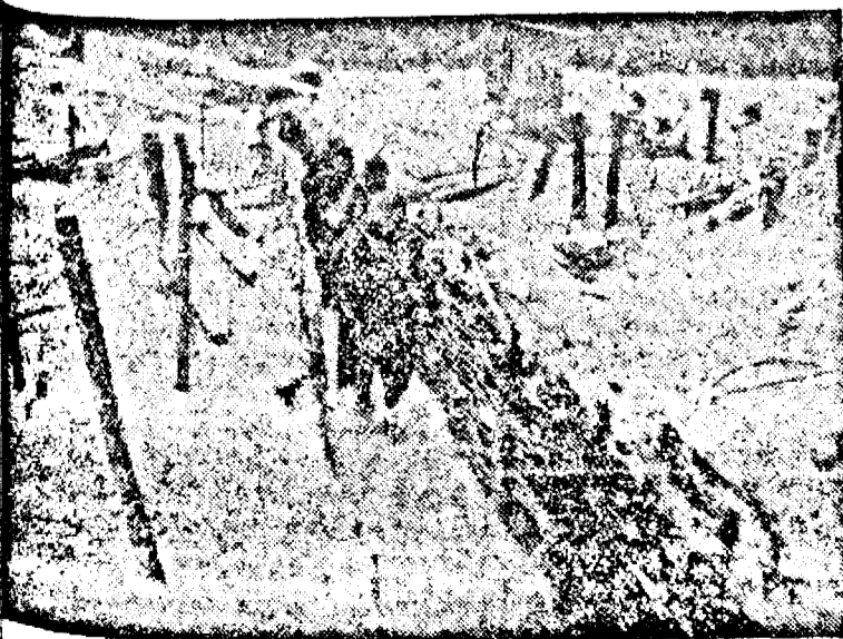
Pe frontul francez

DAȚI, dacă vreți să AVEȚI SUBSCRIEȚI: Bonuri pentru înzestrarea armatei