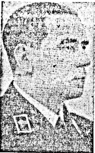
București, 7 (SIR.) — MEMBRII GUVERNULUI S'AU INTRUNIT AZI DI-

Intrunit sub prezidenția d-lui prim ministru G. Tătărescu a dat formă definitivă proiectului-lege pentru ajutorarea familiilor concentraților