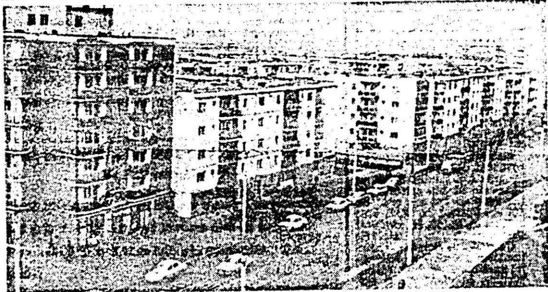
Imaginii ale noului intr-un vechi cartier al Aradului — Micăla.

Exigențele sporite care stau în fața horticulturii arădene — ca, de altfel, în toate celelalte sectoare ale agriculturii din județul nostru — impun mobilizarea exemplară a tuturor lucrătorilor organelor, specialiștilor, buna organizare și desfășurare a tuturor activităților pentru realizarea obiectivelor propuse, pentru a asigura anulul 1989 toate atribuțiile unor ani de producție record în agricultura arădeană.