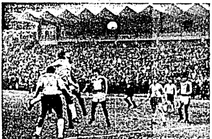
Fază din meciul Poli Timișoara — UTA.

Meciul în sine a avut două reprize diferite. Prima s-a în-