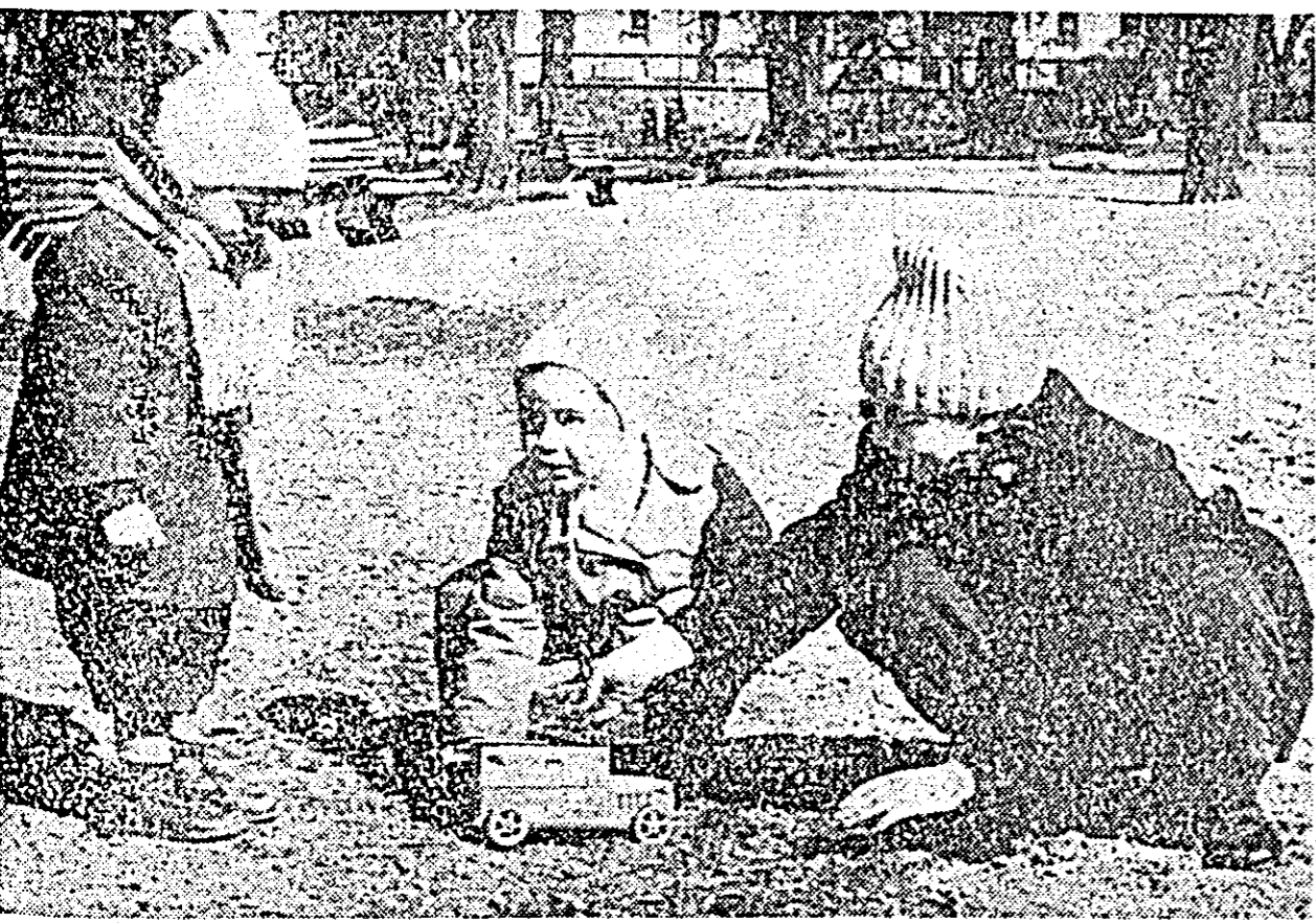
PRIMĂVARA ÎN PARC

cerceător la Staţiunea experimentală agricolă Lovrin.