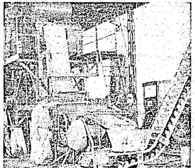
I.P.L.F. „Refacerea”, în plin sezon de recoltare și conservare a mazării. Aspect de muncă la stația de batozare din Felnac.

— Avem un orz frumos, vom obține, sînt convins, o recoltă bună, conform planificării.