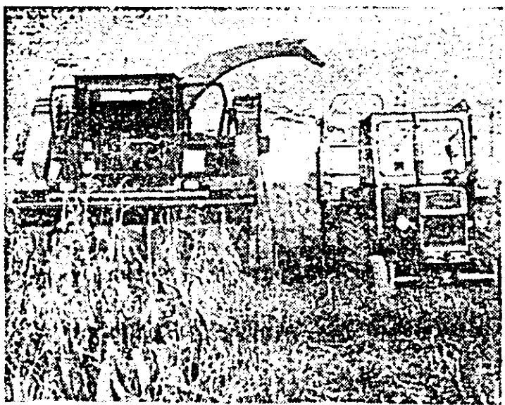
La C.A.P. Vinga, se lucrează „zi-lumină” la recoltarea porumbului.

În aceste zile hotărîtoare pentru soarta recoltei din acest an, precum și a celei viitoare, oamenii muncii de pe ogoarele județului nostru sînt chemați să acționeze cu hotărîre și deplină responsabilitate ca, în spiritul sarcinilor stabilite de tovarășul Nicolae Ceaușescu la Consfățuirea de lucru pe probleme de agricultură să se asigure desfășurarea tuturor lucrărilor în cele mai bune condiții și la parametri calitativi superiori.