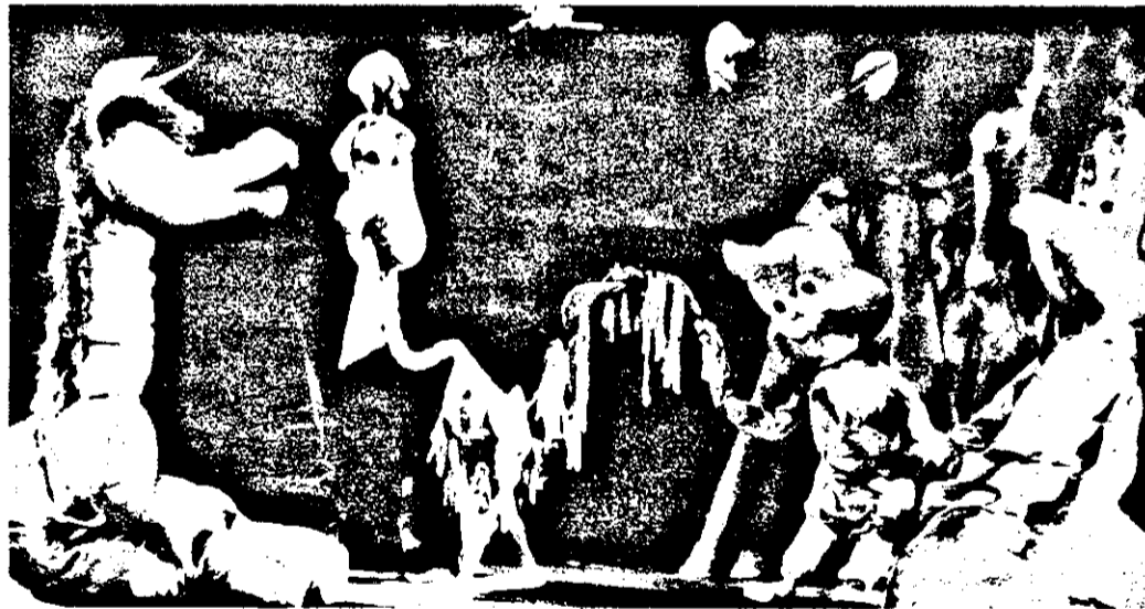
„Muzicanții din Bremen”, un spectacol în care au fost antrenate și copiii - spectatori.