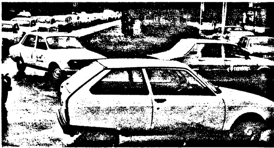
Cozi imense la stațiile PECO. Și cum să nu fie, când la fiecare litru de benzină se pot câștiga 1200-2000 lei?