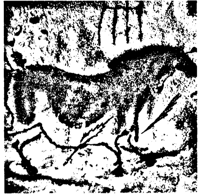
Peștera Lascaux, Franța, - „Cal străpuns de săgeți”

Oamenii primitivi au observat natura, formele ei de manifestare și și-a dezvoltat deprinderi de comunicare din care au apărut ritualurile. În