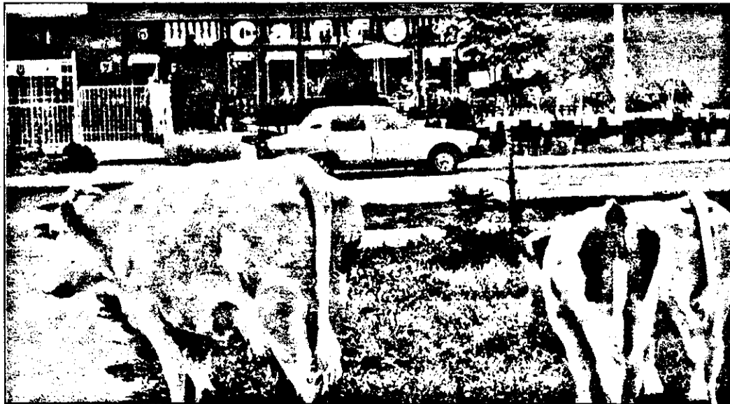
Acu, vă duce mama la cafenea, să vă învățați și voi cu nesusu !...