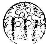
Körömszappan szappan habja.