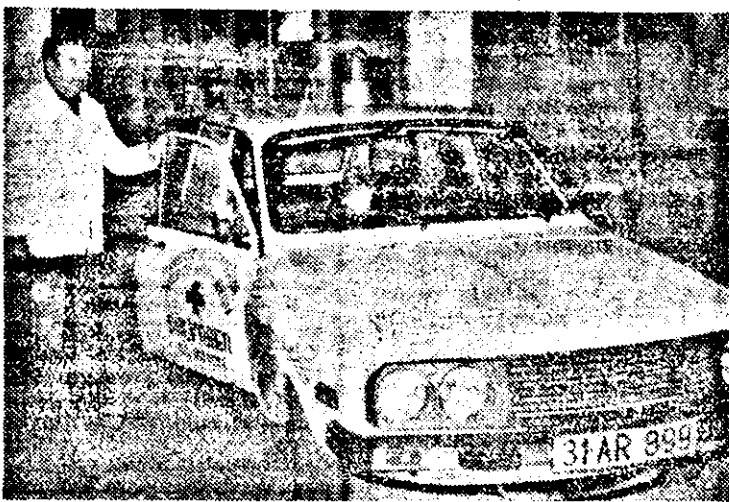
Un apel telefonic și în cîteva minute echipajul Salvării se va afla la domiciliul bolnavului.

chiar cei de vîrstă înaintată? — Întrebăm. Bineînțeles că nu, și poate cel mai bun argument îl constituie faptul că din cele 35-50 de solicitări cărora li se răspunde, în medie, pe noaptea, marea majoritate sînt persoane în vîrstă. Există, totuși, unele priorități, dar ele sînt firești: bolnavii cardiaci, femeile gravide, copiii de pînă la 1