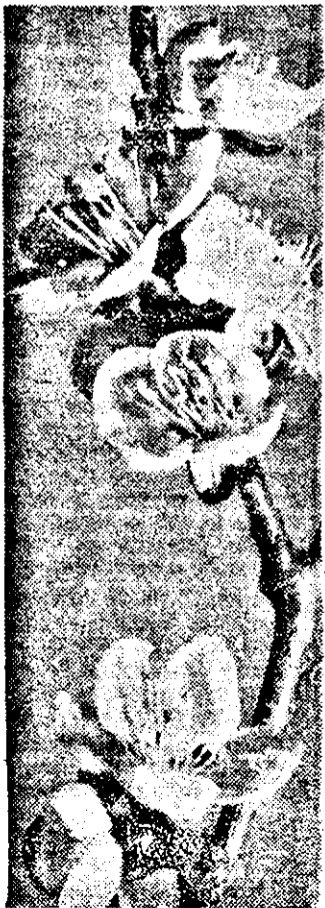
Nu, nu este o glumă. Au înflorit caișii!

LIPOVA: Un bărbat și o femeie (Fr.). ÎNEU: Nava lui Yang (China). CHIȘINEU CRÎȘ: Polițist sau delicvent? (It.). NĂDLAC: Feele berlineză (R.D.G.). SÎNTANA: Călătorie fantastică (S.U.A.). PECICA: Judecătorul (Bulg.). CURTICI: Legenda negrului Charley (S.U.A.). SEBIȘ: Valca prafului de pușcă (S.U.A.). ȘIRIA: Cine va acolo sus mă iubește (S.U.A.). VINGA: Cine ești călărețule? (U.R.S.S.). PÎNCOTA: Memorie regăsită (U.R.S.S.).