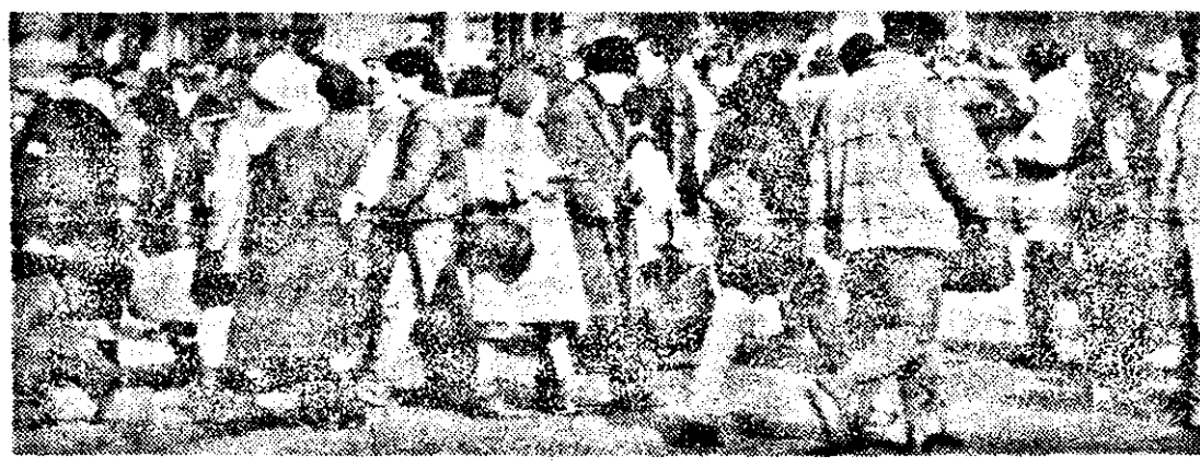
Secvență semnificativă din foriola cotidiană a orașului.