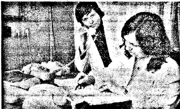
La dispeceratul Salvării fiecărei solicitări i se răspunde cu maximă operativitate.

cel puțin așa consideră cei care telefonează. În această noapte de 26/27 februarie în care ne aflăm alături de personalul Stației de salvare, asistența de urgență medico-chirurgicală la domiciliu este asigurată de 14 autosanitare (dintre care trei autoturisme Dacia break), 12 cadre medii, doi medici generalişti