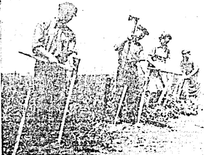
Cooperatorii din Dorobanți se ocupă intens de îngrijirea legumelor. La ferma a doua se instalează șpalleri la cultura roșiilor.