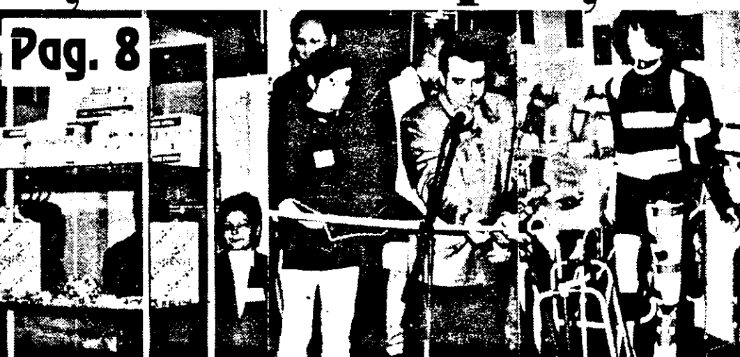
Arădenii s-au arătat interesați de noutățile în domeniul medical