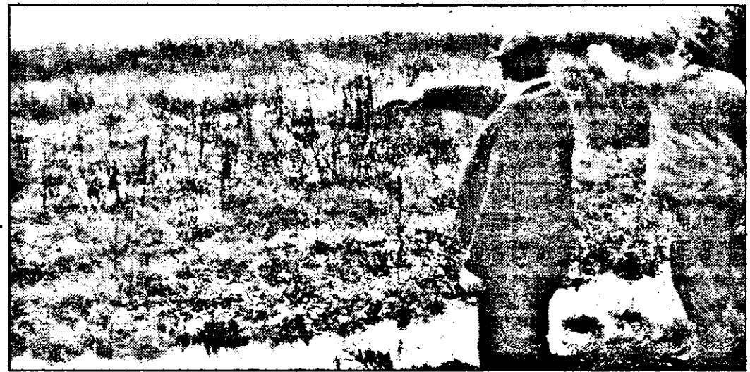
„Teren arabil sau ciulinii Râpsigului. Cu acest pământ au fost împroprietăriți țiganii. Cum l-au lucrat se vede!”

TEODORA MATICA DORU SINACI