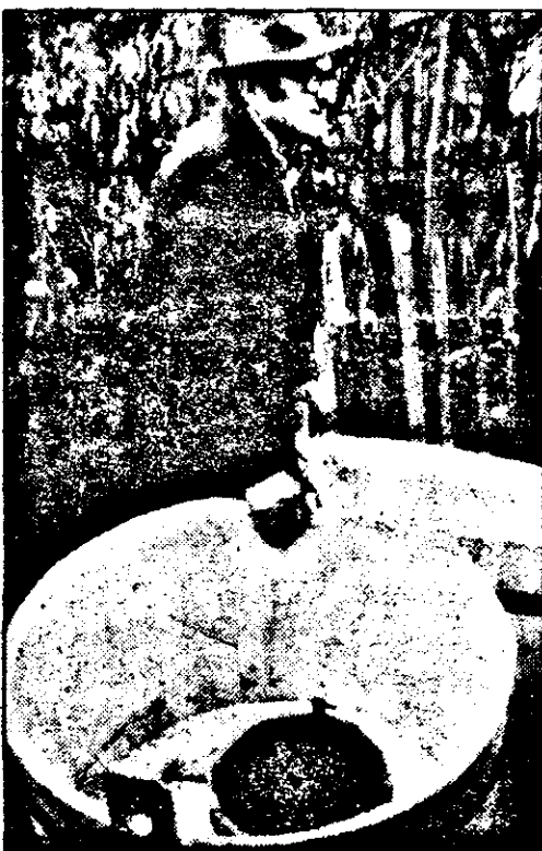
... Tot mai puține se mai gănesc tradiționalele clubare și donițe meștești.