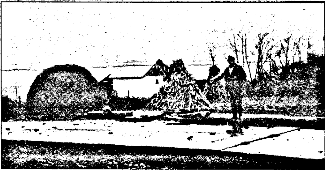
„Cântarul a rămas. Casa cântarului a dispărut...”

Am putea spune că este aproape normal ca bocsiganii, cei care conduc destinele satelor aparținătoare, să tragă spuza (a se înțelege bugetul) pe turta Bocsigului. Normal pentru ei. Pentru că așa se întâmplă peste tot în România. Deși la distanță de doar 6 km de Bocsig, Râpsigul a fost uitat de autoritățile de la centru și devine, pe zi ce trece, țară nimănui. Așa se și explică faptul că abuzurile abundă și nimeni nu este tras la răspundere. Fiecare își face propria lege și acționează în consecință.