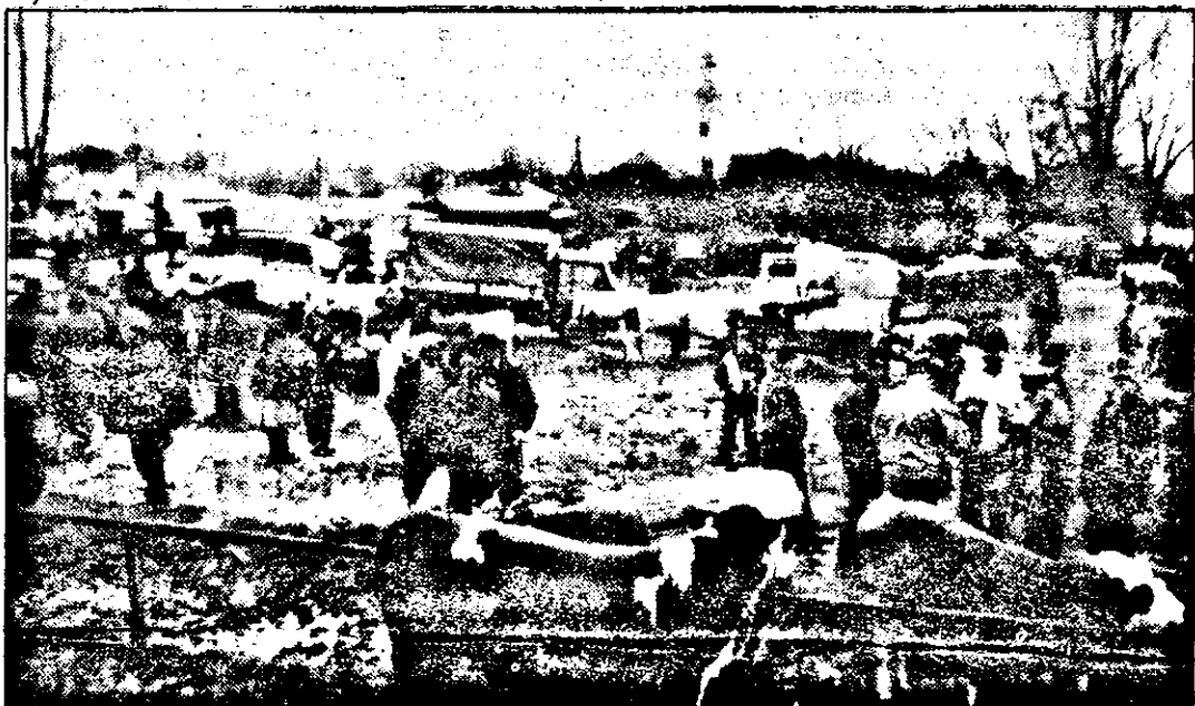
Zi de târg la Hălmațiu...

La Hălmațiu, sâmbătă e zi de târg. Sute de oameni din zonă și chiar din județele Alba, Hunedoara, se adună în piața din comună, care se umple de mașini, căruțe, animale, saci cu grâne, diverse legume. Piața e împărțită în sectoare, în funcție de marfă. Într-o parte se vând cai, în alta vitele. Porcii au locul lor, cerealele de asemenea. Într-un alt capăt al pieței găsești vânzătorii de haine, pantofi sau cosmetice. Însă adevărata atmosferă de târg o simți printre vânzătorii de animale. Frumos aranjate, pregătite pentru vânzare, animalele își așteaptă cumpărătorii.