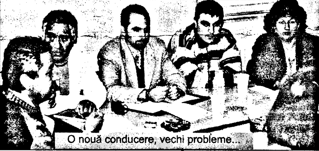
O nouă conducere, vechi probleme...