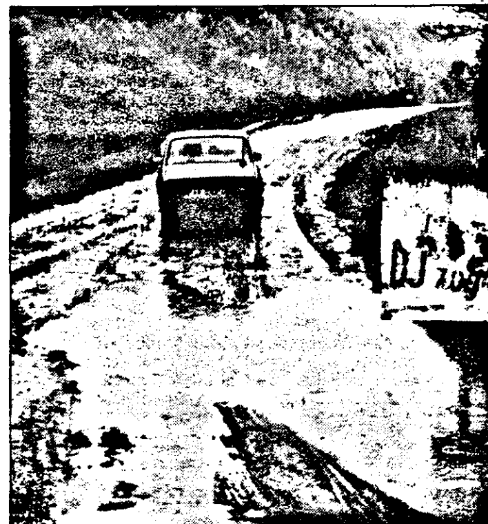
Un drum plin cu gropi, bolovani și băltoace „se dă” drept... județean!