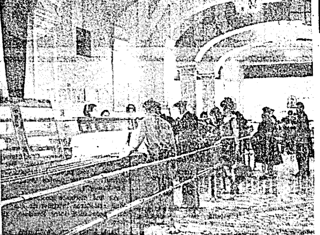
Aspect de la unitatea autoservire „Cornul Vânătorului”.