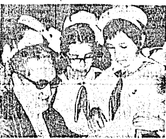
Un autograf, o amintire...