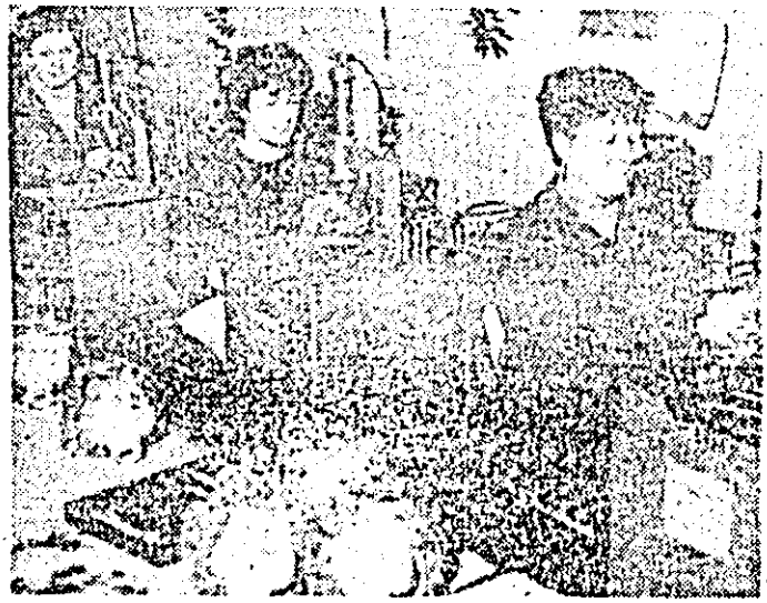
Aspect de muncă la Întreprinderea „Arădeanca”.

Încheierea cu rezultate cît mai bune a planului pe trimestrul IV, precum și pe întregul an, sînt sarcini deosebit de importante pentru fiecare colectiv de oameni ai muncii, concomitent cu preocupările privind soluționarea problemelor de care depinde demararea și buna desfășurare a producției în anul viitor.