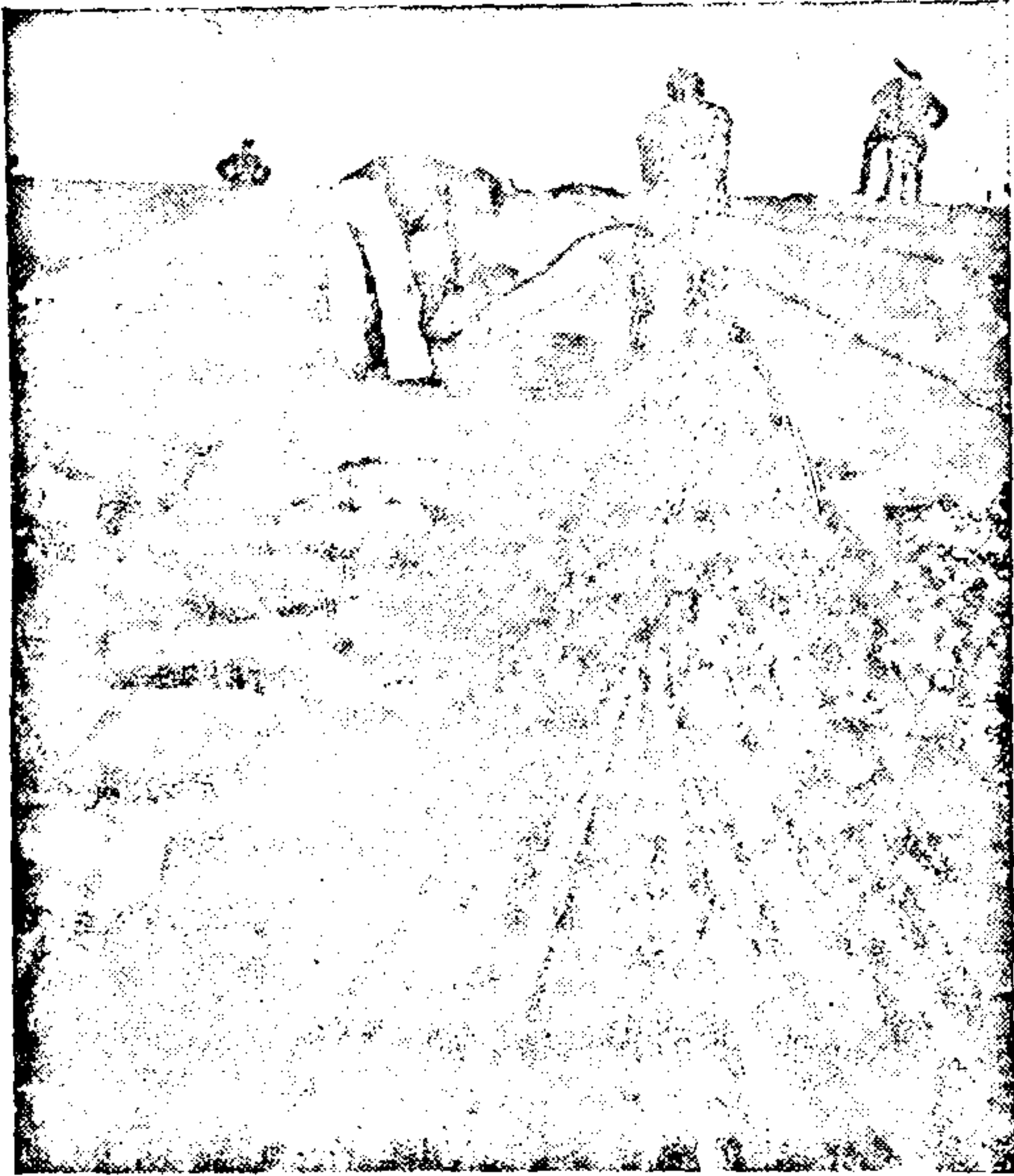
Pioniere beim Brückenschlag. Festmachen der Halttaue.