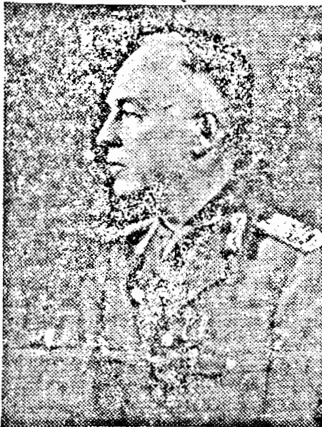
DI. GENERAL I. ANTONESCU Conducătorul Statului Român

„Völkischer Beobachter” scrie că d. general Ion Antonescu, este apreciat în primul rând ca soldat și ca om politic care într'un ceas greu, cu o mână hotărâtă a luat cârma vasului român, și s'a smuls din vârtejul în care fusese îm-