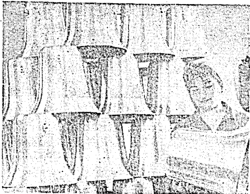
Minte și minile harnicilor muncitori, ingineri și tehnicieni de la Atelierele C.T.C.F.R. din orașul Arad concep și execută numeroase aparate și instalații care contribuie la siguranța circulației pe căile ferate. Iată în imagine un nou lot de difuzoare pregătite a fi expediate beneficiarilor.