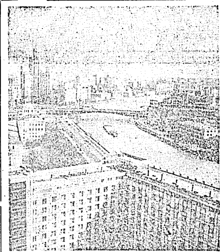
Moscow. Vedere spre cheiurile Moscovei și Koteincaia de pe terasa hotelului „Rosia”.

Tot duminică au fost aleși 52 de senatori și 80 de membri ai Camerei deputaților.