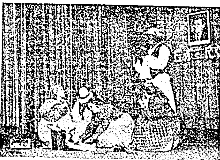
Brigada artistică a căminului cultural din comuna Macea — una din brigăzile artistice cu un frumos palmares, pe scena Festivalului național „Cântarea României”.

Lucrurile stau și mai rău încă în ceea ce privește muzica ușoară și dansul tematic. Uneori formații de acest gen se prezintă în fața publicului pur și simplu improvizat, încît în acest domeniu forurile culturale județene trebuie să găsească forme și modalități ferme și inspirate de îndreptare, atrăgînd spre ele pe cei mai pricepuți instructori și activiști culturali. O orientare greșită