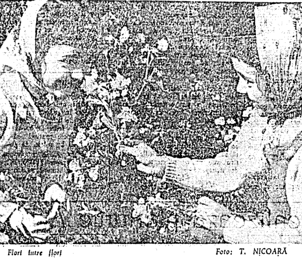
Flori lute flori

Centrul meteorologic Arad comunică: Azi, 30 octombrie, vreme nestabilă, cu cerul variabil, temporar acoperit în sudul regiunii. Vîntul va sufla potrivit, cu intensificări din sectorul sud-est. Temperatura mai mult staționară, ziua va fi cuprinsă între 12 și 18 grade, iar noaptea între 2 și 6 grade, dimineața ceață locală.