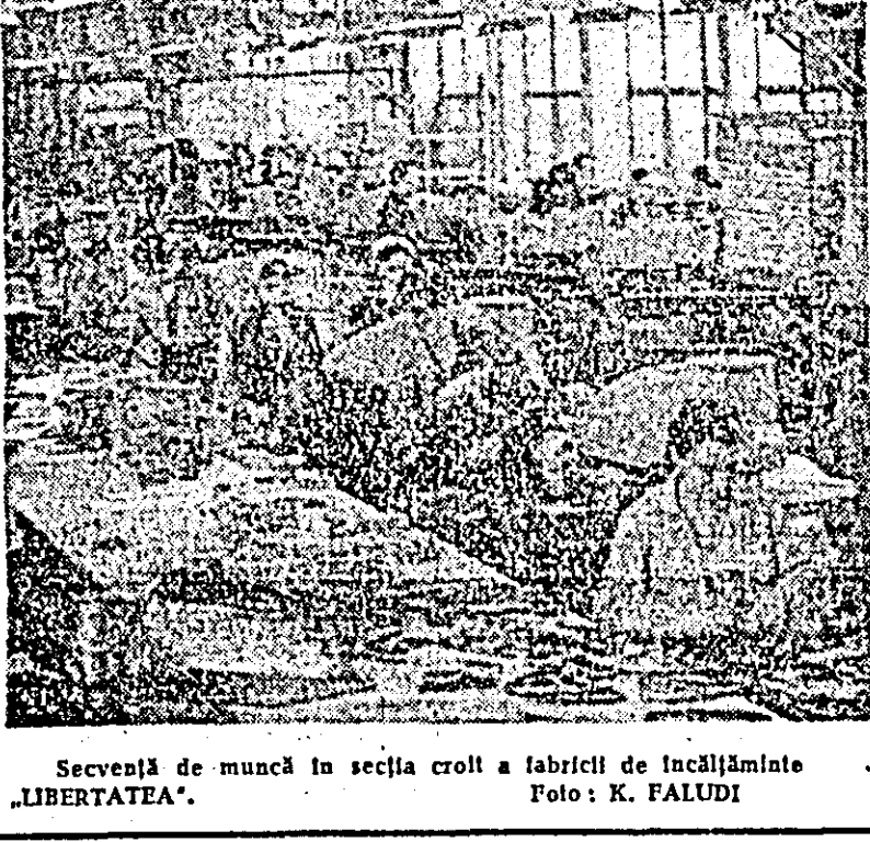
Secvență de muncă în secția croti la fabrica de încălăminte „LIBERTATEA”.

Despre hărnicia și priceperea celor care dau „viață” strungurilor arădene s-a mai vorbit. Și nu o dată. Pentru că acestea s-au materializat în rezultate de prestigiu, le-au ridicat dincolo de nivelurile înscrise în planuri, au făcut ca marca „Uzina de strunguri Arad” să fie cunoscută și apreciată nu numai în țară, ci până departe, pe multe din meridianele globului.