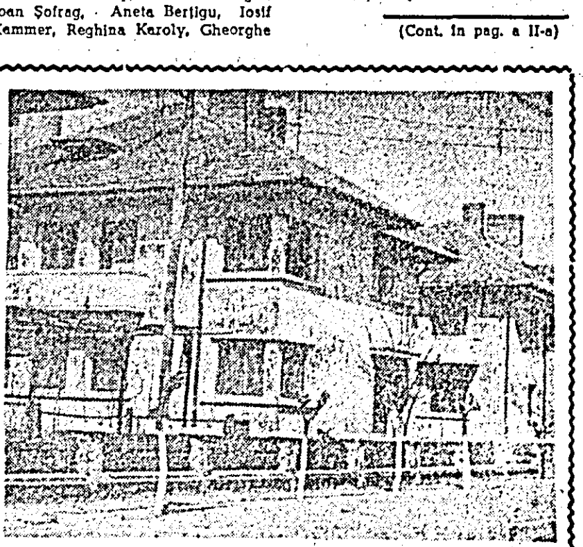
Cartier de blocuri în Lipova.

Începînd de astăzi, cea mai superbă primăvară a României — copilii — intră în vacanță. În județul nostru, ca și altunde, vremea de două săptămîni, frumoasă, disciplinată și emoționantă lîmbă a clopotului școlar va amuși. Dascălii și elevii sînt beneficiarii unui relativ concediu de pasivitate și uneori cu teribile eforturi în timpul unui trimestru școlar.