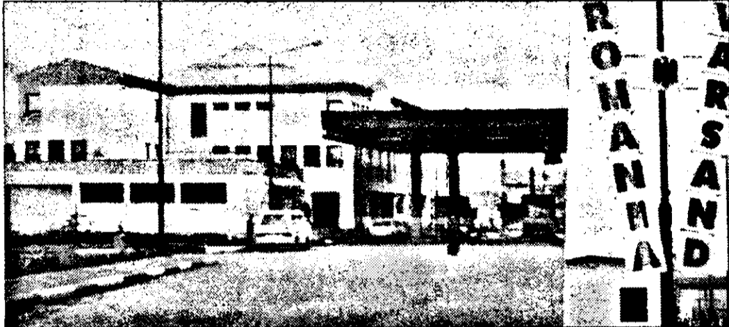
Pe aici a intrat în țară carnea care s-a împuțit în vama Arad.

În ciuda avantajelor ce decurg pentru importatorii maghiari, de la intrarea în vigoare a acordului CEFTA, sunt firme din țara vecină care încearcă să obțină venituri înzecite încercând să eludeze legislația vamală românească în afacerile cu firme românești.