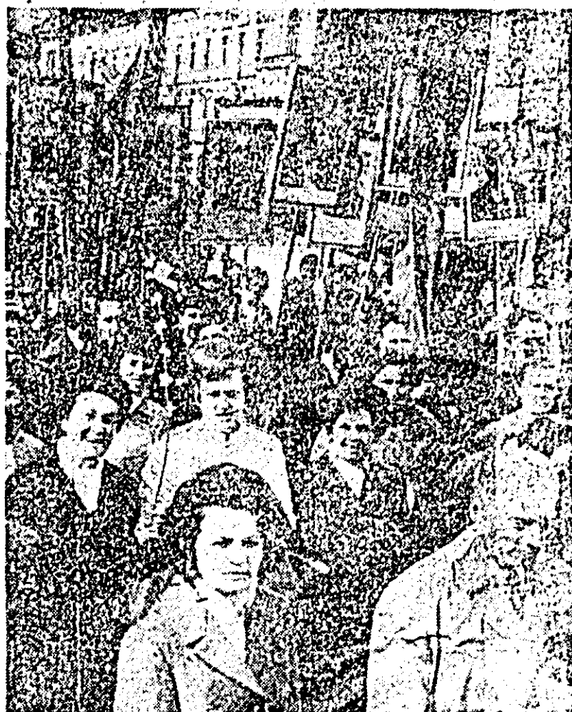
Textiliștii au adus la demonstrație bucuria succesei obținute în muncă.

Muncitorii, țăranii, intelectualii județului Arad, alături de toți oamenii muncii din patria noastră, pătrunși de o nefermuită încre-