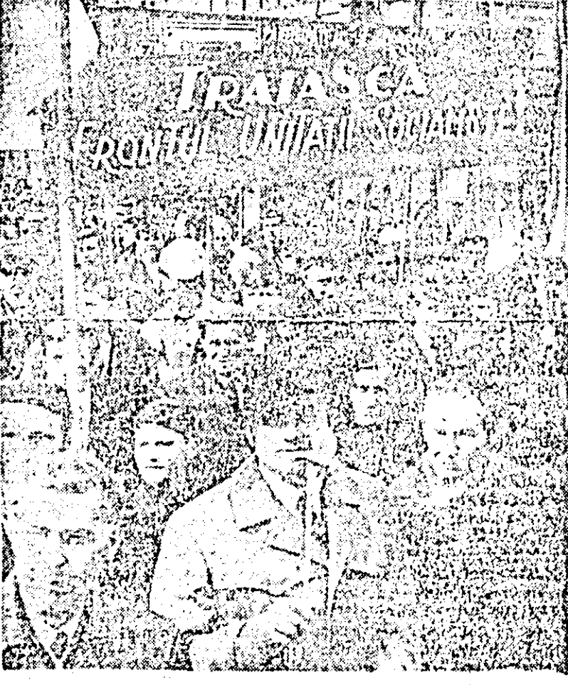
În fruntea coloanelor oamenilor muncii arădeni pășesc constructorii de vagoane.

În după-amiaza zilei de 1 Mai, pe scena împodobită sărbătorește a Teatrului de vară, artiștii amatori din municipiu au prezentat în fața unui numeros public reușite programe artistice închinăte sărbătorii internaționale a oamenilor muncii. Și-au dat contribuția artiștii amatori ai clubului Uzinelor de vagoane, clubului C.F.R. și Liceului agricol din Arad. Seara, la carnavalul tinerețului din parcul orașului, cei prezenți au imprimat petrecerii voiașă specifică vârstei lor.