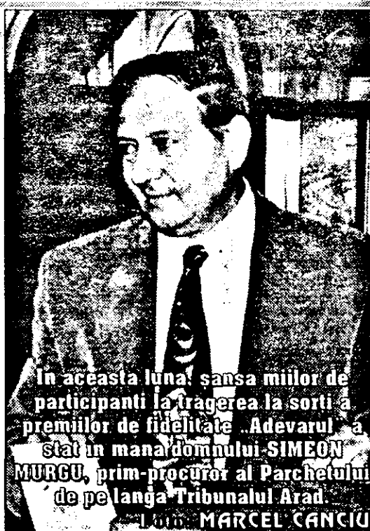
În această lună, sansa miilor de participanți la tragerea la sorti a premiilor de fidelitate „Adevarul” a stat în mâna domnului SIMEON MURGU, prim-procuror al Parchetului de pe lângă Tribunalul Arad.

★ Premiile de fidelitate pe luna iunie - în valoare de 200.000 lei fiecare - au revenit unor abonați din Grăniceri, Sântana, Șimand și Arad.