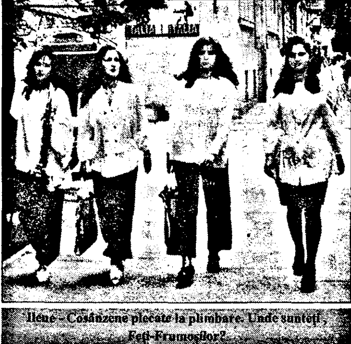
Ilene - Cozânzele plecate la plimbare. Unde sunt? Feți-Frumosilor?