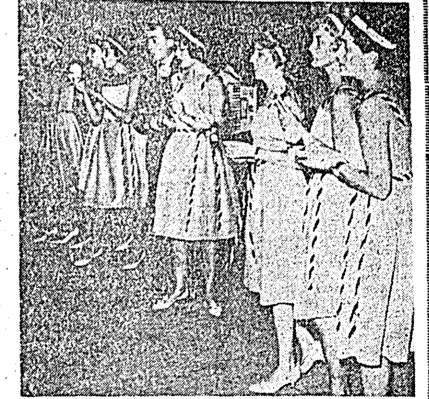
IN CLISEU: brigada artistică de agitație a Uzinelor textile „30 Decembrie” prezentînd programul intitulat: „Uzina-lă în înălțime”.

tuș de atracție. Și aceasta cu atît mai mult cu cît erau anunșate trei din cele mai bune brigăzi artistice printre o ținută artistică matură, cu vocă ample, cu o bună proporționalizare a compartimentelor corale, cu o bună frezare și omogenitate. O remarcă deosebită pentru corul Uzinelor de strunguri privînd grila pentru o interpretare nuanșată, remarcată mai cu seamă în execuția lucrării „Viteazul pasdaru” de I. Chirescu. Și de astă dată, ca și spectacolele precedente ce au avut loc la faza orășenească, brigăzile artistice de agitație au constituit punc-