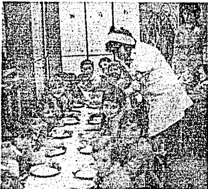
„Poftă bună!”, Aspect de la grădinița de copii I.M.A.I.A.