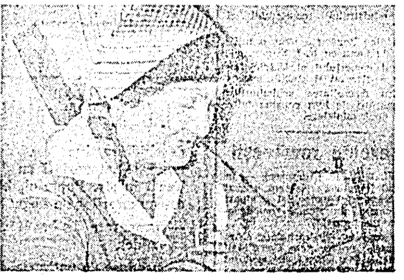
Secția tricotațe comandă a cooperativei „Mureșul” din Lipova...