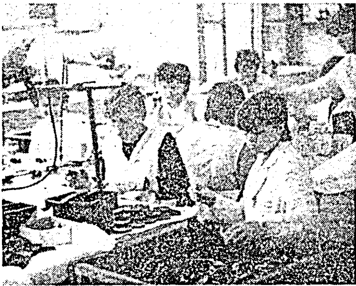
Întreprinderea de ceasornice „Victoria”. Aspect de muncă la linia II montaj.