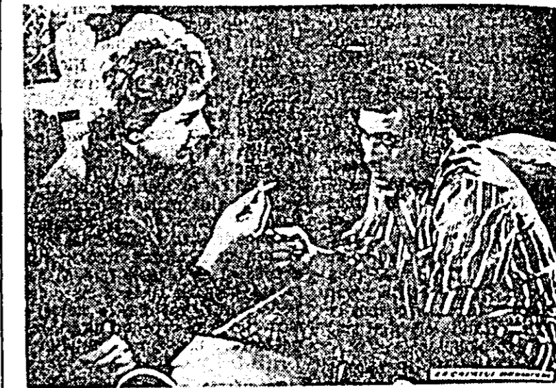
În clișeu: o secvență din film.

Noua producție a studiourilor bulgare ridică o problemă deosebit de importantă — problema vigilentei, a descoperirii și demascării dușmanului de clasă a lo cărui uneltiri încearcă să lovească în interesele poporului bulgar, care construiește socialismul. Tocmal în această constată mesajul profund educativ al filmului „La capătul drumului”.