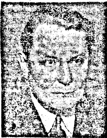
GÖRING, porosz miniszterelnök

Budapestről jelentik: Göring német miniszter, porosz miniszterelnök, ma dé-