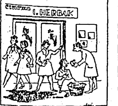
Cel care iese de la cinematograful „Alădată” trebuie să ne lăsam umbrela...

În timpul vizionării filmelor, unii cetățeni consumă semințe, făcînd astfel murmurul și deranjînd pe ceilalți spectatori. Împotriva acestora și a celor care vînd semințe în fața cinematografulor, a teatrelor etc. trebuie să se ia măsurile necesare.