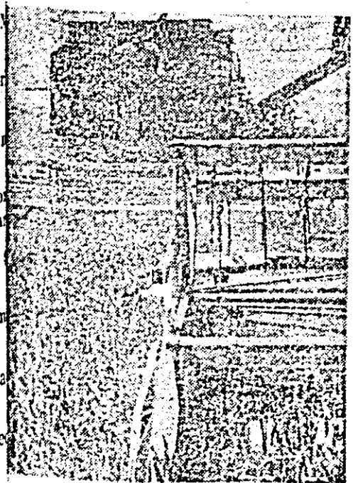
Seceriș la C.A.P. Șimand