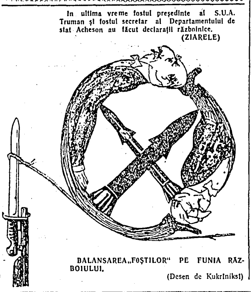
BALANSAREA „FOȘTILOR” PE FUNIA RĂZBOIULUI. (Desen de Kukrinski)

La Paris au sosit știri din care reiese că duminică au avut loc dezordini similare și în Oran, unul din cele mai importante orașe ale Algeriei, unde elementele extreme dreapta, demonstrînd lozinci ca „trăiască Massul” și încercat să ocupe clădirea postului de radio. Ele au fost împrăștiate de poliție.