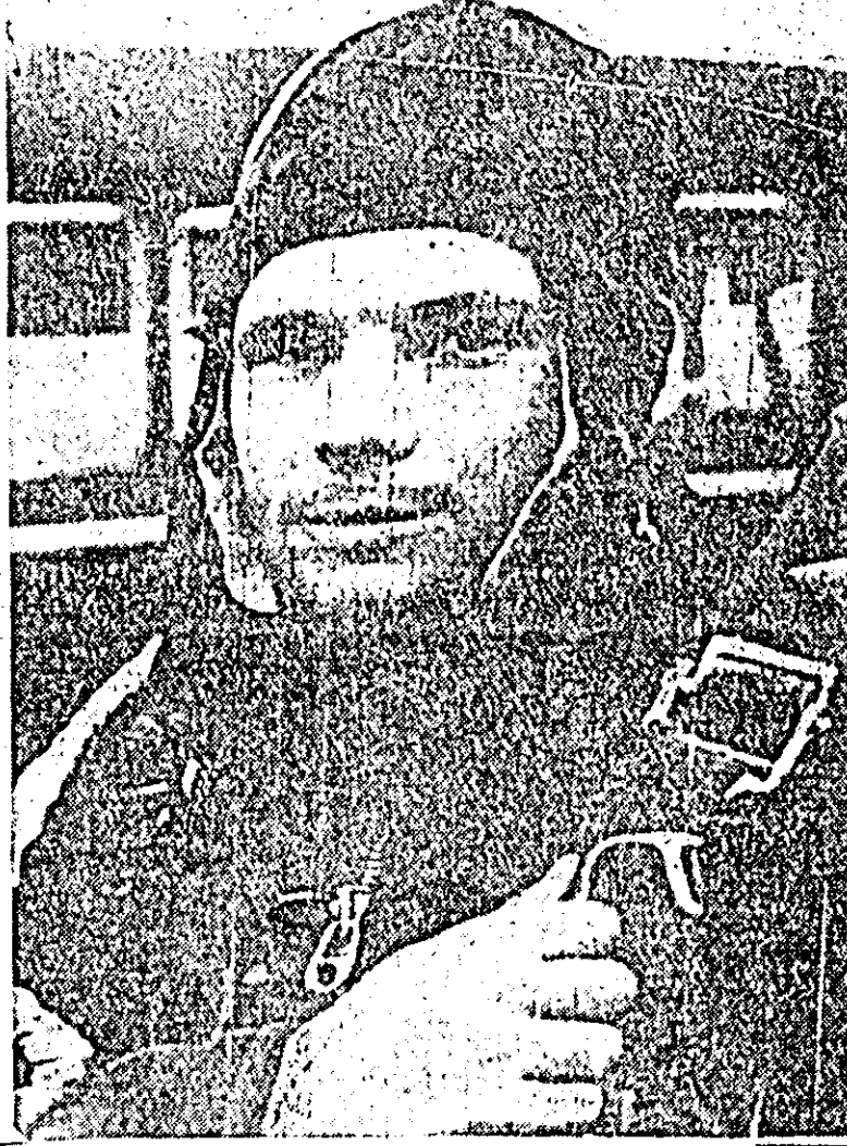
MOSCOVA 12 (Agerpres). — TASS transmite: Maiorul sovietic Iuri Gagarin a aterizat în bune condiții în regiunea stabilită din URSS.