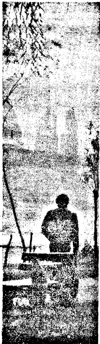
Mureșul cu peisajul specific îndeamnă la meditație...