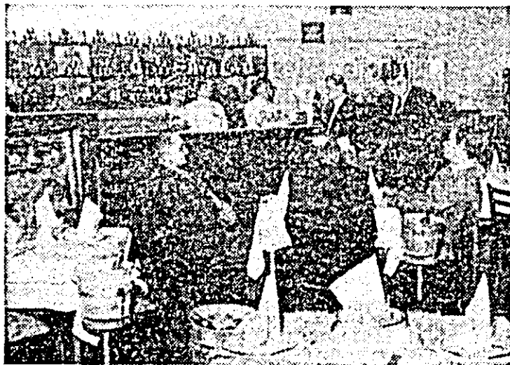
Începînd de ieri, a fost dat în folosință, complet renovat, restaurantul din stajia C.F.R. Arad. Unitatea servește un bogat sortiment de preparate culinare.

De curînd în cartierul Aurel Vlaicu, în locul fostului bufet „Turist”, s-a deschis o unitate nouă, complet renovată, „Gostat”, care oferă o gamă largă de preparate din carne și legume-fructe. (Florea Borod, coresp.)