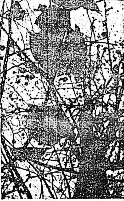
Impresii de sezon.

Un caz rar, care l-a uimit pe oamenii de știință, s-a petrecut în Parcul marin din Havana, situat lângă insula Oahu. Despre ce este vorba? O femelă de delfin a născut un pui în urma împerecherii cu o mică balenă neagră.