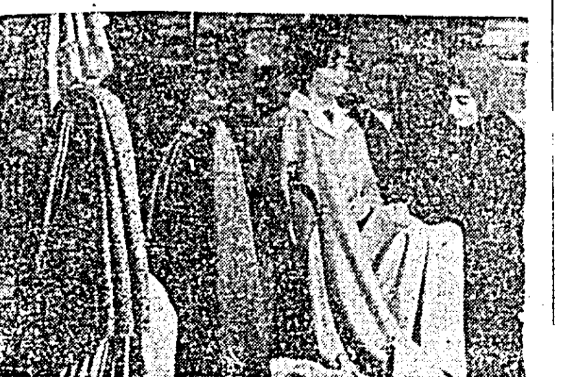
E greu să alegi dintr-un sortiment atât de bogat de țesături.