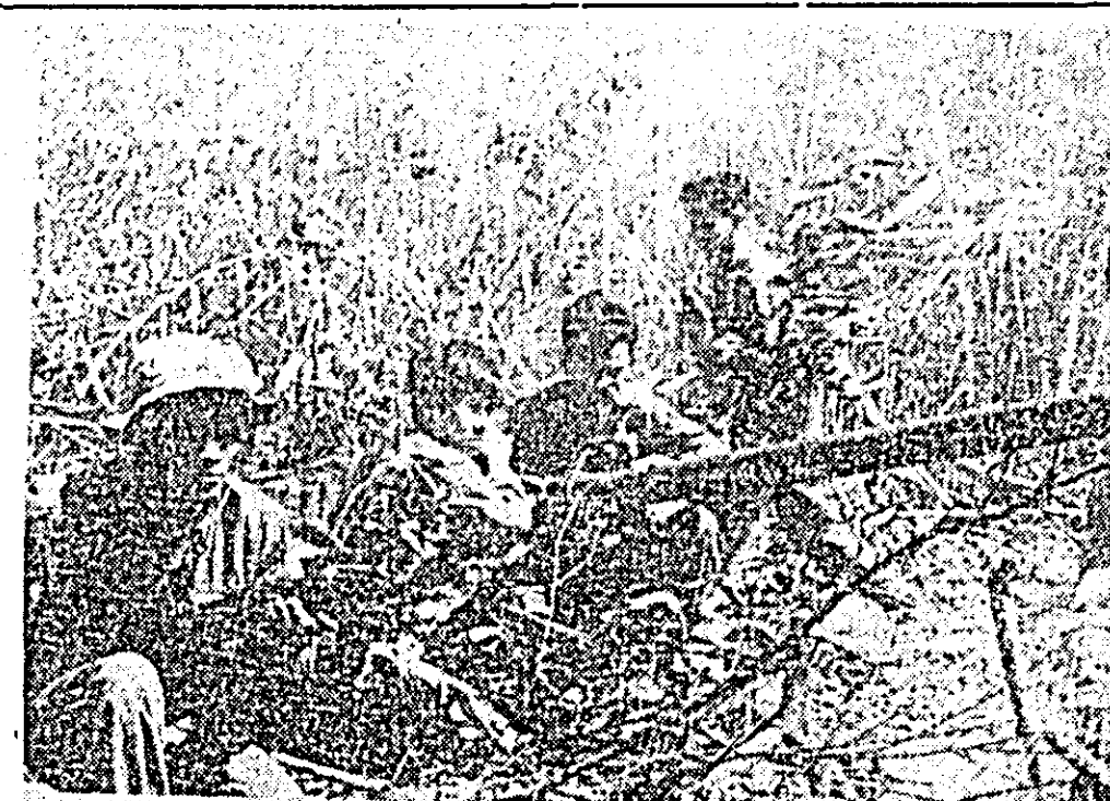
VIETNAMUL DE SUD. Pe liniile fronturilor din Vietnamul de Sud ostașii ai Armatei de Eliberare își continuă atacurile avînd drept țel alungarea inamicului și eliberarea întregului teritoriu. IN FOTO: A-tac pe colina 544 la nord de Quang Trî.