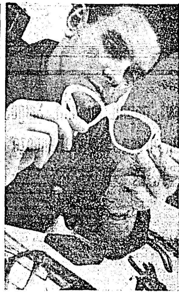
Modelele de ochelari pe care le execută cu mare măiestrie Intreprinderea „Progresul” din Arad...