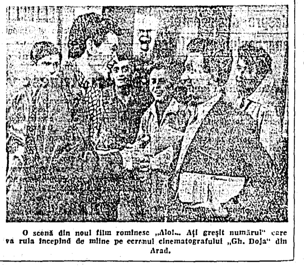
O scenă din noul film românesc „Alo... Ați greșit numărul” care va rula începînd de mîine pe ecrinul cinematografului „Gh. Doja” din Arad.