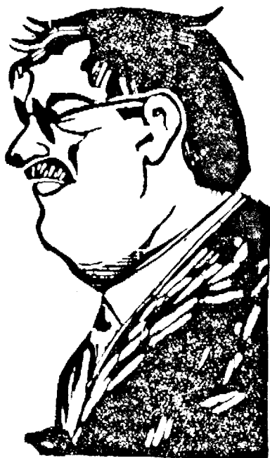
Șearpele cu ochelari