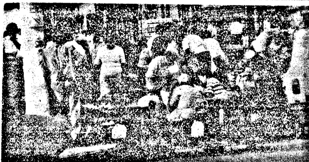
Piața „Fortuna”: Ce se mai dă, ce se mai vinde, cum se mai vinde?