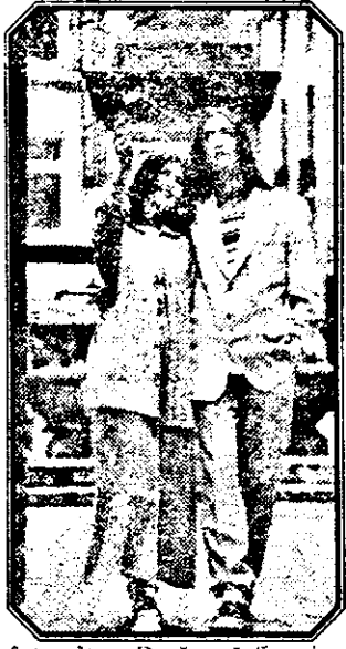
intrucută. Dacă e să fim sinceri, trebuie să recunoaștem că individul nu-i „curat” ca lacrima. Vreau să spun că la vârsta lui (25 de ani) orice