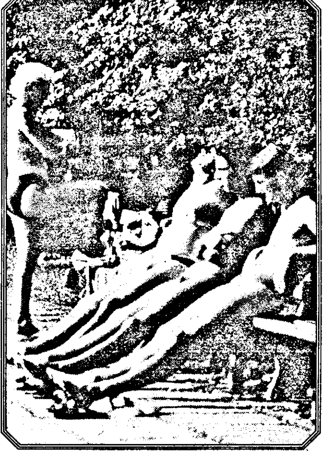
Expunere de... „motive”!